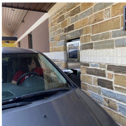
Udendørs automat for bilister

Biblioteket har mulighed for at aktivere, deaktivere og ændre i funktionernes omfang og opsætning. Ændringerne kan for eksempel være udskrift af kvittering på papir eller via e-mail eller fravalg af kvittering for aflevering. Status, overvågning og ændring af indstillinger sker med softwaren LibManager, som er en selvforklarende og stilren webgrænseflade, der nemt kan tilgås direkte fra personalearbejdspladserne.