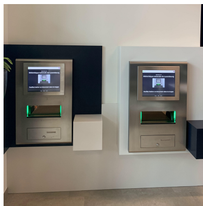
Indendørs automat med touchskærm